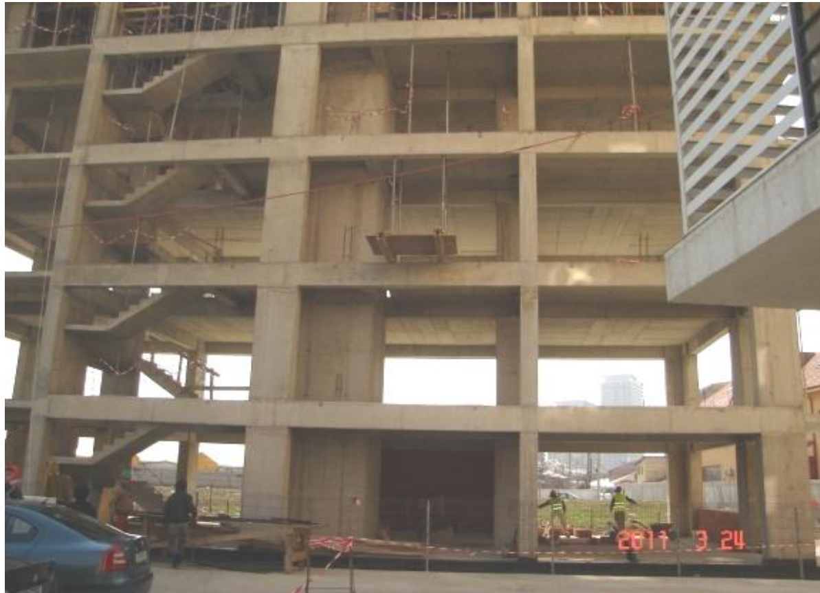
Centrul de afaceri - RPF Development