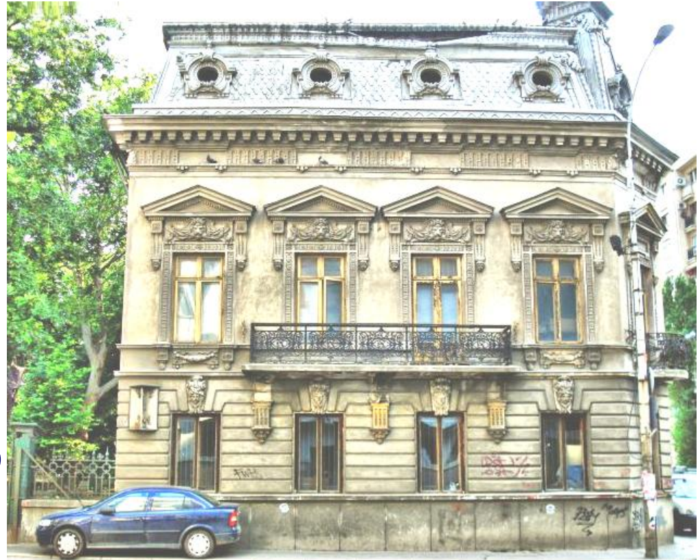
Reabilitarea CASEI CESIANU