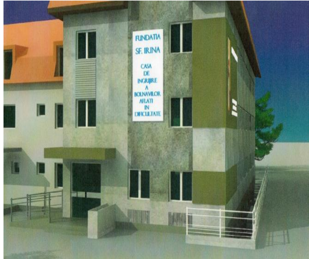
Proiectul Fundatiei Sfantei Irina